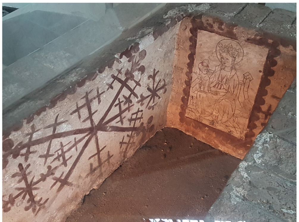
Menschen hoffen, nach dem Tod „ins Schöne“ zu kommen. So wurde es vor 800 Jahren an die Wände einer kleinen Grabkammer in Brügge gemalt, Foto: Hans Brunner